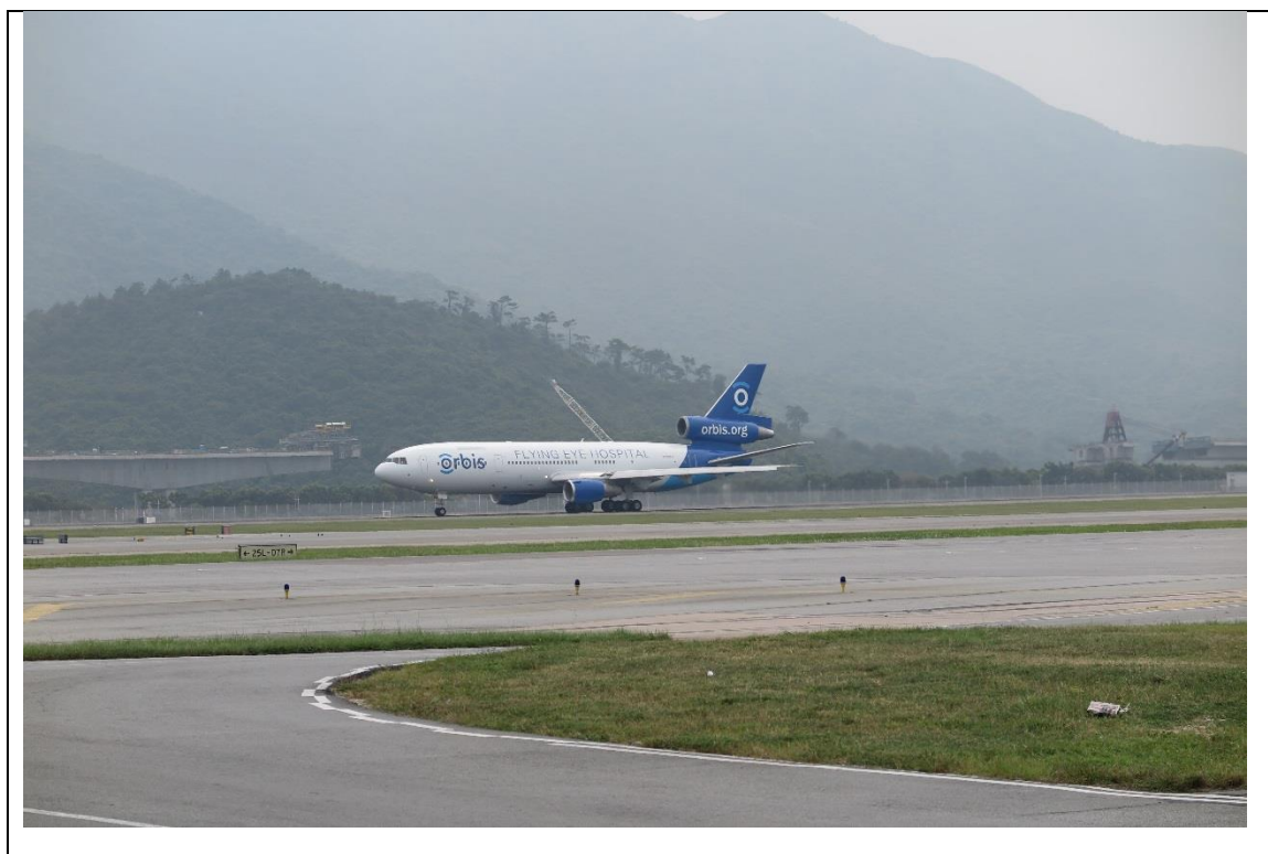
相片 1: 奥比斯眼科飞机医院从香港国际机场起飞