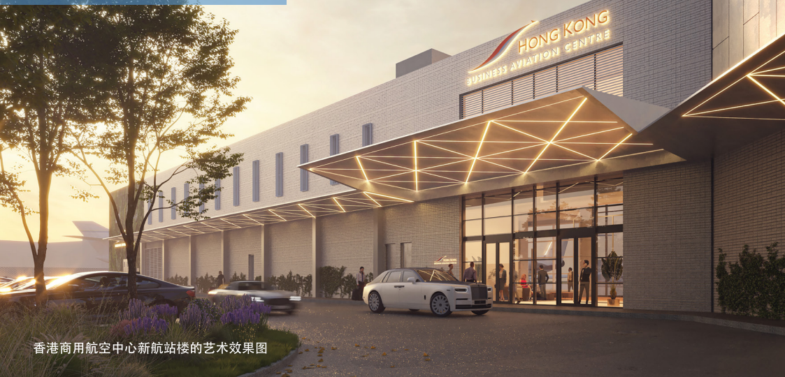
香港商用航空中心新航站楼的艺术效果图